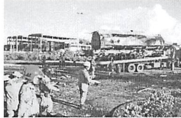
Na manhã de ontem, após resfriamento, tanque foi removido de via

Um grave acidente foi registrado na madrugada de sexta-feira, dia 23, em São Luís. O condutor de um caminhão-tanque perdeu o controle do veículo, que capotou em uma das rotatórias da Avenida dos Holandeses, no bairro Calhau. Após a queda, houve uma explosão e o caminhão foi consumido pela chamas, que atingiram outros veículos e estabelecimentos comerciais. A vítima foi o motorista do caminhão, que foi socorrido com graves queimaduras e encaminhado para uma unidade de saúde da cidade.